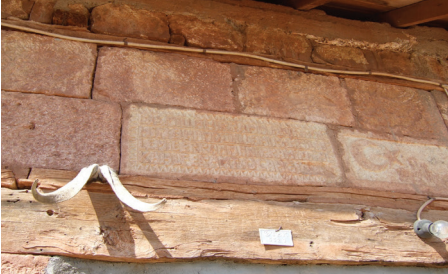
Foto2: Köy evlerine asılan kurban boynuzları, Tunceli.