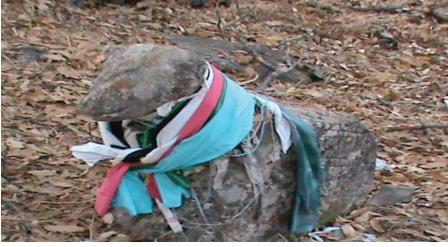
Foto 1: Hasan Halife ziyaret yerinde boynu renkli bezlerle süslenmiş koç başlı bir mezar taşı. Bu mezar taşı, eski Türklerin kurbanlıklarını süslemesinin bir taklidi mahiyetinde etnografik bir delil olması bakımından dikkat çekicidir. Tunceli/ Pertek, Koçpınar Köyü.