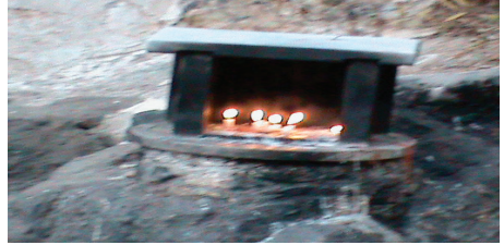
Foto 5: Kurban tıglanırken yakılan mum. Eski Türklerde kurban kesilirken ya da kötü ruhlardan korunmak için mum yakılmıştır. Tunceli/ Gole Çetu ziyareti.