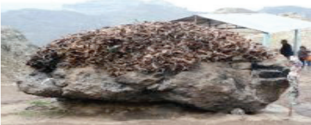
Foto3: Yüksek bir kaya üzerinde saygı ile korunan çok sayıda kurban boynuzu. Tunceli/Nazimiye, Düzgün Baba Ziyareti.