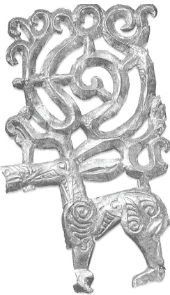
Şekil 2: M.Ö. 4. yy.a ait altın işlemeli geyik tasviri

Yine Jacobson yaratıcı, hayatın kaynağı ve soyun atası olarak kabul edilen geyiğin “Erken Göçebe” ve “İs-kit-Sibirya” kültürünü anlamak için yegâne anahtar olduğunu ileri sürmektedir (Jacobson 1993: 46, 1-4) Sibirya kültüründe güneş, altın ve geyik birbirleri ile özdeşleştirilmiş ve kabilenin kökeni olarak kabul edilmişti (Jacobson 1993: 33).