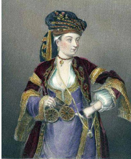
Resim 2. Leydi Montagu Osmanlı kıyafeti ile. Kont Harrington'un (1844) özel koleksiyonundan. Ulusal Portre Galerisi, Londra.

aktarıken dervişlerin hepsinin elbisesinin rengini beyaz olarak verir ve sadece şeyhlerinin kıyafetinin yeşil olduğuna değinir. Gündüzöz (2003: 77-84), beyazın hayatı ve ruh temizliğini simgelediği için Kur'an'da ve cennette olumlu anlamlara geldiğini; yeşilin ise canlılık ve tazelik anlamında kullanılan doğayı temsil ettiği için, cennette müminlerin yeşil bahçelerde yeşil elbiseler içinde tasvir edildiğini belirtir. Böylece Montagu, İslam dininde beyaz ve yeşil renklerinin dinî, sembolik ve kültürel önemini ve kullanım yerleri hakkında edindiği bilgiyi de yansıtmış olur.