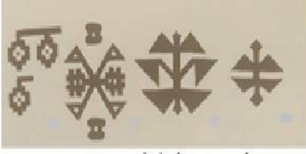
Resim 2 (Erbek 1986: 15)