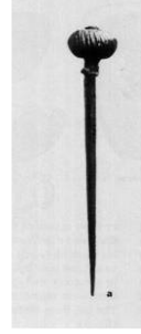
Levha 2: Kültepe'den bronz iğne Özgüç 1986: pl. 11 a-b.

den değerlendirildiğini ifade etmiştir. Haşhaş bitkisi ve bolluk/bereket sembolü olarak kabul edilen haşhaş kapsülü başlı metal süs iğnelerinin, Urartu sanatında da büyük önem taşıdığı ifade edilmektedir. Söz konusu iğneler günümüzde Ahlat Müzesi'nde yer almakta ve M.Ö. 8. ve 7. yüzyıla tarihlendirilmektedir (Göğtaş vd. 2019: 535vd.).