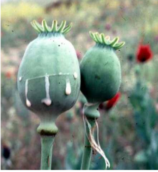
Levha 1: Haşhaş kapsülü Mat 2009: 287.

Geç Hitit Dönemi tanrıçası Kubaba'nın sembolleri de, Anadolu'da bitkinin tanındığını kanıtlar niteliktedir. Tanrıça Karkamış'ta bulunan tasvirlerinde, elinde ayna ve nar/haşhaş tutarken betimlenmiştir. Hnila (2002:315-323), Kargamış'tan gelen bir Kubaba tasvirini, Birecik ve Ancuzköy'de bulunan birkaç örnekten yeni-