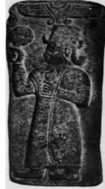
Levha 4: Birecik Kubaba Kabartması Akurgal 1961: Abb.115

yola çıkarak, bu betimlerde yer alan meyvenin uzun saplı olması, elde tutulma şekli ve taç yapısına dikkat çekilerek, bunların nar olmayıp, haşhaş olabileceği ihtimali üzerinde durmuştur (Levha 3-4). Hnila, haşhaş ve nar tasvirlerinin sıklıkla birbirine karıştırıldığını, daha önce nar olarak kabul edilen birkaç tasvirin, haşhaş olarak