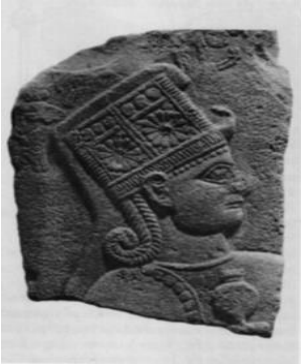
Levha 3: Karkamış Kubaba Tasviri Bossert 1942: no. 866

Geç Hitit Dönemi tanrıçası Kubaba'nın sembolleri de, Anadolu'da bitkinin tanındığını kanıtlar niteliktedir. Tanrıça Karkamış'ta bulunan tasvirlerinde, elinde ayna ve nar/haşhaş tutarken betimlenmiştir. Hnila (2002:315-323), Kargamış'tan gelen bir Kubaba tasvirini, Birecik ve Ancuzköy'de bulunan birkaç örnekten yeni-