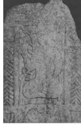
Levha 7-8: Mezar Taşlarında Haşhaş Motifleri Ünver 1978: Resim 3-5

Osmanlı Dönemi Anadolu'sunda afyon, tentür veya ekstre halinde ağrı kesici özelliği ile tıbbi tedavi uygulamalarında; keyif verici özelliği sebebiyle kahvehane gibi sosyal ortamlarda ve aktarlarda satılan afyon içerikli macun da çocukları uyutmak için sıklıkla kullanılmıştır (Mat 2009: 285-286). Tedavi edici, uyku verici, uyuşturucu etkisinin dışında, amber, tarçın, safran gibi çeşitli aromatik maddeler ile karıştırılarak afrodizyak etkisi sebebiyle de tercih edilmiştir (Onaran 2016:189, Mat 2009: 285, 286).