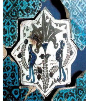
Levha 5-6: Kubatabat Sarayı Duvar Çinileri Arık 2000: 192, No: 262, 99, No. 85.

mayan bebeklere anason ve afyon verilmesini önermiştir (Demirhan Erdemir 2018: 198, 207). Ayrıca, hastanın uykuya dalmasını sağlamak amacıyla yapılan anestezi için, şaraba haşhaştan elde edilen afyon ve diğer karışımlar eklenerek içirilmesini salık vermiştir (Gomoiu 1937: 41). Gündelik hayata dair pek çok alanda karışımıza çıkan haşhaş, ölümü ve ebediyeti simgeleyen mezar taşlarında da sıklıkla betimlenmiştir (Levha 7-8). 14. ve 20. yüzyıllar arasına tarihlenen Orta Anadolu şehirlerine ait mezar taşlarında haşhaş dalı ve kapsül motiflerinin yer aldığı çok sayıda örneğe rastlanmıştır (Ünver 1978: 15vd, Yörükân Karamağaralı 1982: 468,469).