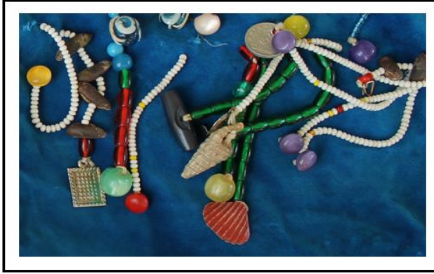
Fotoğraf 6: Süsleme malzemeleri detay görünümü

Yarlığın ön bedeninde nazar boncuğu, mavi boncuk, hurma çekirdeği, deniz kabuğu gibi farklı objeler kullanılarak süsleme yapıldığı Fotoğraf 6’da görülmektedir. Halk arasında sağlıklı ve gülbüz çocuklara çabuk nazar değdiğine dair inanışın yaygın olduğu dikkate alındığında, giyside yapılan süsleme ile kötü bakışa sahip olan gözün dikkatini parlak ve cazip olan bu objelere çekmek amaçlandığı düşünülmektedir. Çünkü yörede, nazarın tüm potansiyelinin, ilk bakışta açığa çıktığına inanılmaktadır.