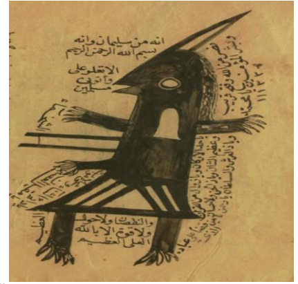
Risalenin son bölümünde iki sayfalık Ümmü Sıbyan duası bulunmaktadır.