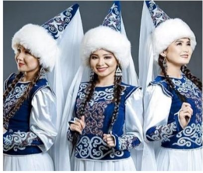
6. İki örüm saçı ve şökülölü (evlenecek) kız

http://vzglyadriv.kg/sdelay-sam/7802-kyrgyzdyn-uluttuk-bash-kiyimderi.html