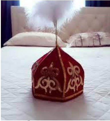
1. Ükü/takiya topu