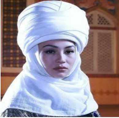
3. Eleçekli bayan