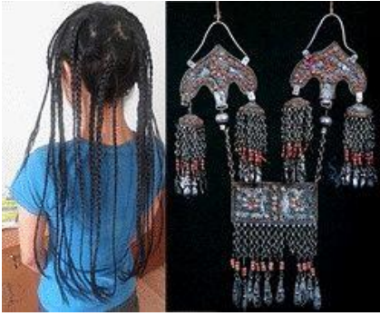
5. Beş kökül kız ve çaçpak