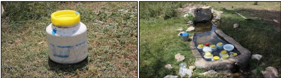
Fotoğraf 4. Yaylada peynir üretimi ve üretilen peynirlerin muhafazası

Yayla ekonomik olarak da büyük bir önem arz etmektedir. Bu dönemde süt sağımı yapılmaktadır. Sağılan süt, miktarına göre aynı gün veya birkaç gün biriktirilerek işlenmektedir. Bu kapsamda tereyağı, yoğurt ve peynir üretilmektedir. Tereyağı ve yoğurt ailenin ihtiyacı kadar üretilirken, peynir daha fazla üretilmektedir. Üretilen peynirler suyundan arındırılarak tuzlanmakta ve içine maya kekiği/kaya kekiği ( Saturejacuneifolia ) serpiştirilerek plastik bidonlara basılmaktadır (F:4). Bu bidonlar yaylada konaklanan süre boyunca sütlükler ile çeşmelerin hatıllarında muhafaza edilmekte olup, yayladan köye dönüşte satılmaktadır. Yine son yıllarda Kurban Bayramlarının yaz aylarına denk gelmesi ile birlikte yaylada kurbanlık koyun ve kuzu satışları da gerçekleştirilmektedir.