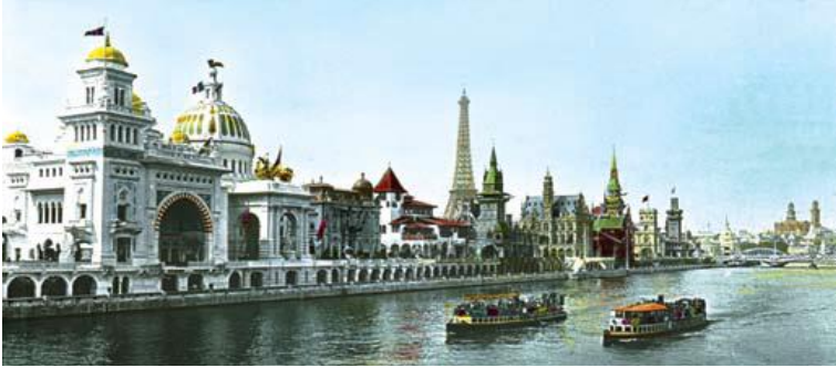
Resim 8. 1900 Paris Sergisi'nde Türk Pavyonu (Işıklı 2012: 161).

Paris'te 543 dönüm alan üzerine kurulan 1900 yılındaki son büyük dünya fuarında Osmanlı pavyonunun Sen Nehri kıyısı boyunca düzenlenen Milletler Caddesi'nde (Işıklı 2012: 160), (Resim 8) politik öneminden ötürü İtalya ve Amerika Birleşik Devletleri'nin arasına konumlandırıldığı ve Fransız Mimar Adrien-Rene Dubuisson tarafından detaylı bir sergi salonu şeklinde tasarlanan bu yer için hükümetin 70000 $ gibi bir meblağ harcadığı bilinmektedir (Çelik 1992: 88-110).