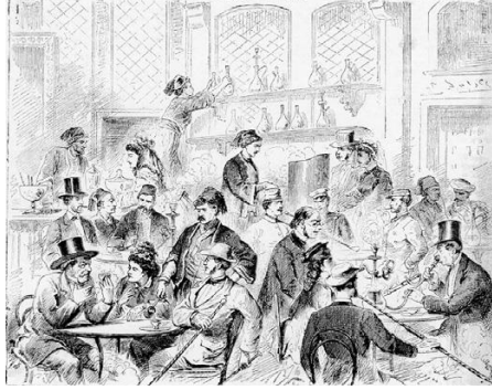
Resim 1. 1873 Viyana Sergisi Osmanlı kahvehane pavyonu (Işıklı 2012: 53).

Çeşmesi, bedesten, köşk, Hazine-i Hassa, porselen fırını, hamam, kahvehane pavyonlarının bulunduğu ve nargile ve tütün çubukları (Resim 1) ile ilgi uyandıran kahvehanede bir grup müzisyen tarafından müzik ziyafetinin verildiği bilinmektedir (Işıklı 2012: 46-53).