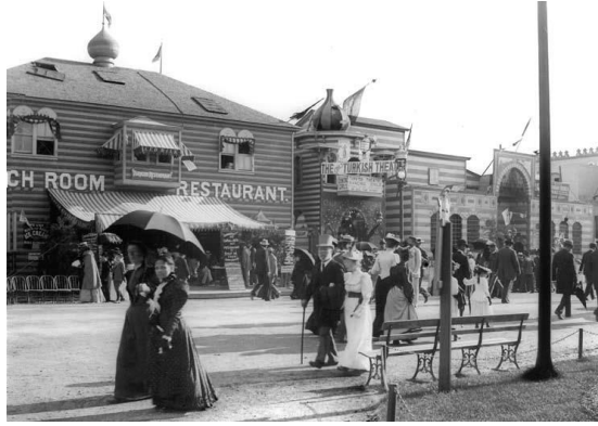
Resim 6. 1893 Chicago Sergisi Türk Tiyatrosu (Işıklı 2012: 121).

Ay yıldız armalı İstanbul Sokağı yazısıyla tanımlı bir ana girişi ve bunun yanında yıldız formlu parapet vari çatısıyla bir kafeyi içeren Türk Köyü'nün (Resim 5) açılışı için, cadde ortasına "tak" yapıldığı bilinmekte (Işıklı 2012: 113); girişle aynı aks üzerinde bulunmasından ve civarındaki yapılara göre daha anıtsal kemerli görüntüsünden ötürü, kafenin yanında ikinci bir giriş şeklinde hizmet verdiği düşünülen takım hemen bitişiğinde Türk Tiyatrosu yer almaktadır (Resim 6). Ancak bu tiyatro, Dünya sergileri kitapçığının, 1893 Chicago Sergisi kısmında ifade edilen Türk Tiyatrosu çizimiyle (Resim 4) sadece daha üst ölçekten bakıldığında gözlemlenebilen dikdörtgen bir kütlelin uzun kenarı boyunca sıralanmış ufak pencereleri, burayı tanımlayan iki kulesi (Resim 3) ile benzeşmekte ve birebir örtüşmemektedir. Dolayısıyla sergideki tiyatro pavyonunun, Türk Tiyatrosu çiziminde yapılan çeşitli değişikliklerin tezahürü bir mekan olduğu düşünülmektedir. Nitekim hem Türk Tiyatrosu çiziminde (Resim 4) hem artık çizimin bazı farklılıklarla sergiye uyarlanmış hali sayılan tiyatro yapısında (Resim 3), (Resim 6) yarı doğulu yarı batılı bir mimari üslup kullanıldığı göze çarpmakta; çizimde Dutch roof (parapetli beşik çatı) adlı strüktür ile pagodaları ve sayvanları andıran iki kulenin kemerli bir arkad yoluyla birleştirildiği (Resim 4) ve fuardaki tiyatro yapısının (tuluat binası) kemerli girişinin soğan bir kubbe ile taçlandırıldığı (Resim 6) görülmektedir.