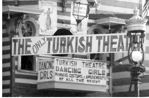
Resim 7. 1893 Chicago Sergisi'nde Türk Tiyatrosu Afişi (Lorentz 2014).

kültürel hayata aktif katılan kadın kimliği konusunun; sekülerizm, yeni yaşam biçimi, geleneksel rolden uzaklaşma gibi yaklaşımları içeren modernite kavramıyla veya Osmanlı modernitesiyle doğrudan ilişkili olduğu bilinmektedir. Ayrıca Türk Tiyatrosu'na yapılan vurgu ulusçuluk, vatandaşlık bilinci bağlamında afişteki söylemi moderne yakınsamakta, bütün doğunun gelenek ve göreneklere ifadesi ise nispeten geleneksel kalmaktadır.