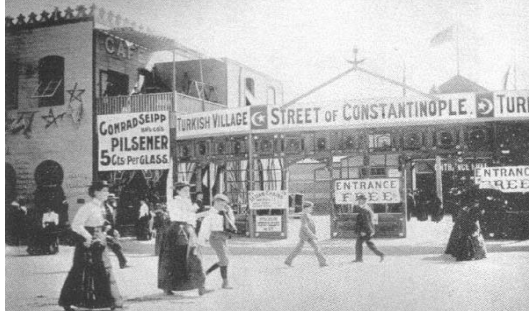
Resim 5. Chicago Sergisinde Osmanlı Köyü- İstanbul Sokağı Giriş (Lorentz 2014).