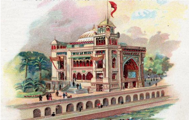
Resim 10. 1900 Paris Sergisi'nde Türk Pavyonu (Dadyan 2018).

1900 Paris Sergisi'ndeki Türk Pavyonu; Barok stile referans veren, merdivenindeki ve çatısının kasağıyla birleştiği yerlerdeki kıvrımları, anıtsal sütun ve parçaları, locası, çeşitli açıklıklarla bölünmüş kulesi ve barındırdığı klasik üslup ile Beaux-Arts tarzıyla örtüşmektedir (Resim 10). Böyle büyük bir organizasyonda ülkelerin bulunacağı konumların önceden belirlenmesi beklendiğinden; Türk Pavyonu'nun Amerika Birleşik Devletleri ve İtalya arasında yer alacağı bilgisi, Osmanlı Devleti'ni belli bir uyum yakalamak adına Beaux-Arts'a yönlendirmiş olmalıdır; zira Beaux-Arts'ın Amerika'da 1880'lerde New York'ta, 1890'larda Richmond Jefferson Hotel'in inşasıyla (Resim 9) Virginia'da görülmeye başlandığı ve 1900'den sonra ulusal bir takıntı haline geldiği, talep edildiği ve İtalyan Rönesans sanatından izler taşıdığı bilinmektedir (Novelli, Chris vd. 2015: 107).