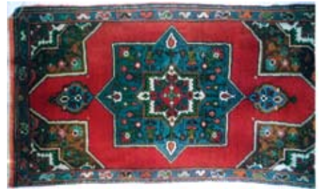
Şekil 5. “Yeminli” (kırmızı zeminli).

Seccadeden daha küçük boyutta dokunan bu halılarda yine göbekte ve köşe motiflerinde çeşitli çiçek ve yaprak