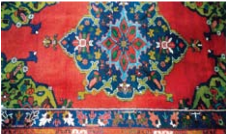
Şekil 7. "Hayriler"

Adını köşe motifinden zemine doğru yerleştirilmiş boru çiçeğinden alan bu desende de ortada iri bir göbek motifi ve köşe motifleri yer almaktadır. Geniş bor-