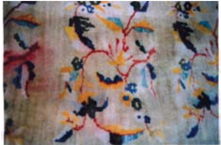
Şekil 9. "Yapraklı"

Köşe motiflerine basamaklı şekli veren ve köşenin kenarında sıralanan kü-