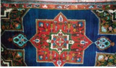
Şekil 6. "Yeminli" (mavi zeminli).

motiflerinin stilize edilmiş formları yer almaktadır. Kırmızı ve mavi ağırlıklı olmak üzere, yeşil, beyaz, siyah, sarı ve kahverengi kullanılan renklerdir (Şekil 5 ve Şekil 6).