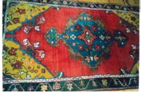
Şekil 8. "Borulu"

dürde iri çiçek motifleri dallarla birleştirilmekte ve bir ters bir düz şekilde dokunarak sıralanmaktadır.