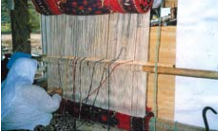
Şekil 2. Tezgah

boyunun bu hareketli düzenekle ayarlanabilmesini sağlayan basit bir araçtır. Çözgü çözme aletinin olmadığı durumlarda toprağa iki sağlam ahşap çubuk çakılarak da bu işlem yapılmaktadır.