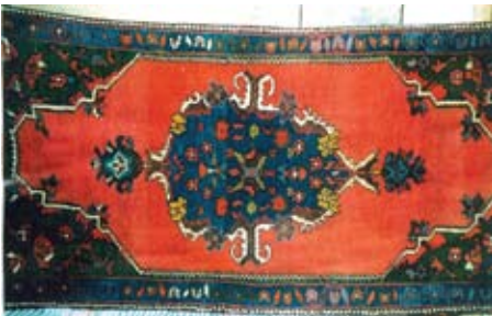
Şekil 11. Seccade.

Bu halılarda da diğerleri gibi stili-ze bitki motifleri ile oluşturulan köşe ve göbek motifleri yer almaktadır. Ancak göbek motifi halının ortasında her iki kenara doğru bakıldığında simetrik değildir. Seccade olarak kullanıldığı göz önüne alınırsa mihrap ve ayetliğin yerinin belirlenmesi amacı ile bu şekilde dokunduğu düşünülmektedir. Zemin kırmızı renktir. Bordürde çiçek ve yaprak motifleri bir