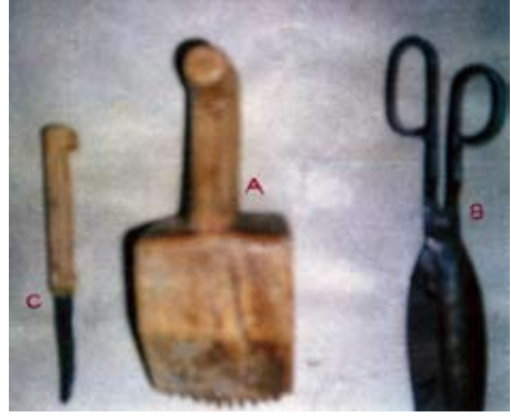
Şekil 3. (A) Kirkit(B) Makas(C)Bıçak.

Yörede dokumacılar daha önceleri dokumada kullanacakları yün halı ipliklerini kendileri hazırlamaktaydı. Günümüzde ise artık hazır iplik satın alıp kullanılmaktadır. Bu hazır iplikleri de genelde boyanmış halde almaktadırlar. Çok az sayıda dokumacı hâlâ bitkisel