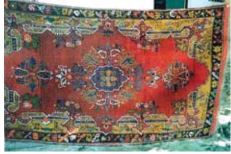
Şekil 4. “Bitmez köşe”

Bu desenle dokunan halılarda köşe motifleri köşede tamamlanıp bırakılmakta, halının dört kenarında da devam etmektedir. Motif köşede bitirilmediği devam ettiği için de bu desene bitmez köşe adı verilmektedir. Göbekte iri bir