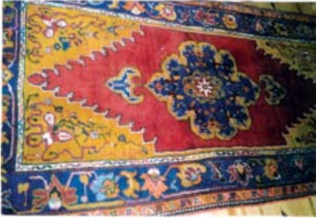
Şekil 10. "Düğmeli".

çuk yaprak motiflerinden dolayı düğmeli adını almaktadır. Kırmızı zemin üzerinde iri bir göbek motifi, her iki kenarda da birbiri ile birleşik köşe motifleri bulunmaktadır. Geniş bordürde iri çiçek ve yaprak motifleri dar bordürde ise küçük çiçek motifleri sıralanmaktadır. Bordür zemininde mavi, köşe motifinin zemininde hardal sarısı rengi kullanılmaktadır. Pembe, açık mavi, beyaz, bordo, siyah, açık yeşil kullanılan diğer renklerdir (Şekil 10).