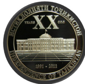
Şekil 1: XX Years/Sol, 1991-2011 İstikloliyati Tocikistan Independence of Tajikistan

Yeryüzündeki karaların altında birini kaplayan, coğrafi sınırları itibarıyla tarihin kaydettiği en büyük